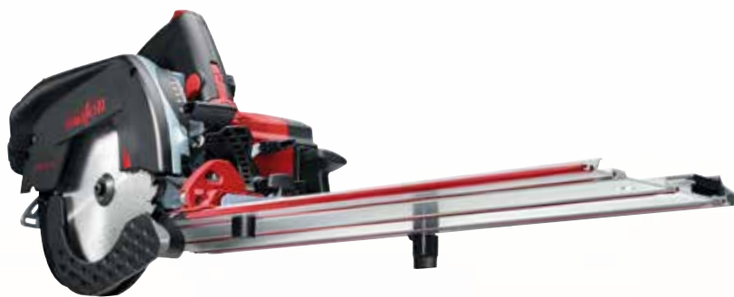
Pilarka ukośna KSS 50 18M bl w metalowej walizce Nr. kat.: 919325