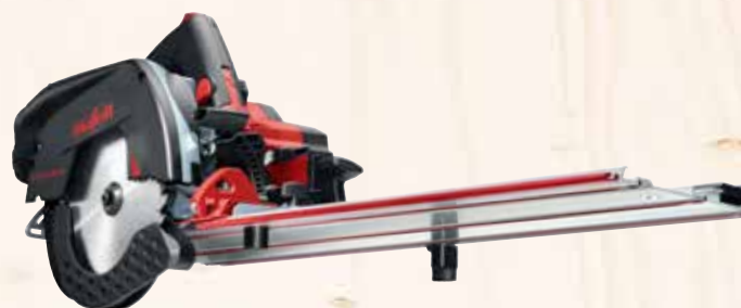
Pilarka ukośna KSS 60 18M bl w metalowej walizce Nr. kat.: 91A525