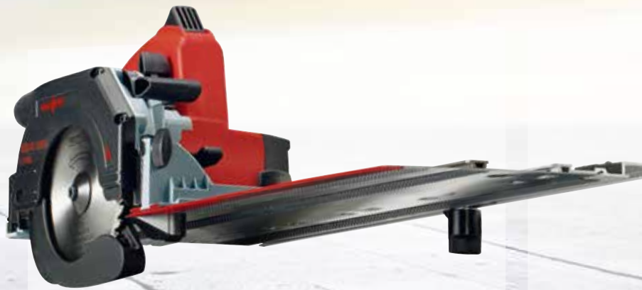
Pilarka ukośna KSS 40 18M bi w T-MAX Nr. kat.: 919825

Cena promocyjne ważna od 01.01. do 30.04.2019