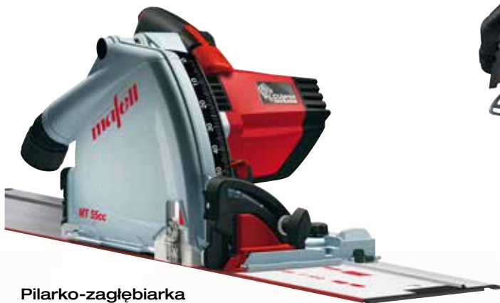
Pilarko-zagłębiarka MT 55 cc MidiMAX w T-MAX z F 160