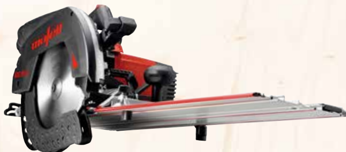
Pilarka ukośna KSS 80 cc /370 Nr. kat.: 918525